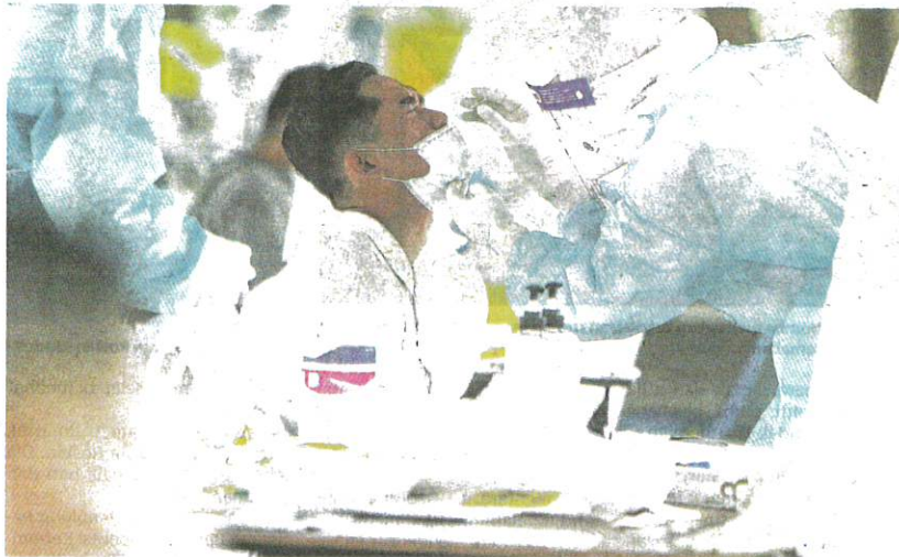
PETUGAS Kementerian Kesihatan giat melakukan ujian saringan kepada penduduk di Hospital Lama Alor Setar, Alor Setar kelmarin.

"Sehingga hari ini (semalam) sejumlah 128 individu telah disaring dalam kluster ini terdiri