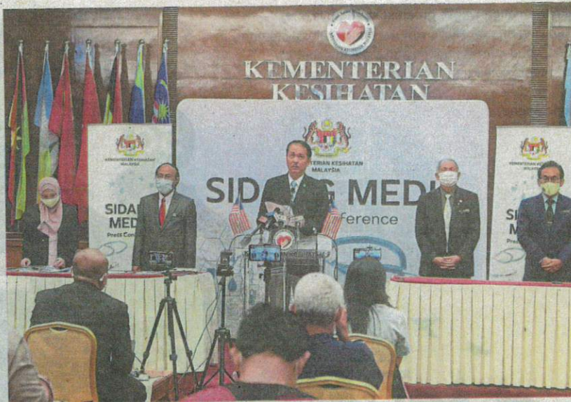
Line of defence: Dr Noor Hisham presenting a report during a daily media conference on Covid-19 infections at the Health Ministry.

Dr Noor Hisham, who revealed that the effective reproduction number, or the Rt, in the state was