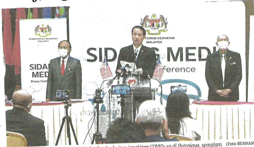
Dr Noor Hisham pada sidang media harian berkaitan jangkitan COVID-19 di Putrajaya, semalam.

Dr Noor Hisham berkata, hasil saringan kes kontak rapat dan pengesanan secara aktif daripada wanita itu yang menjadi kes ke-9,940, seramai lapan lagi individu