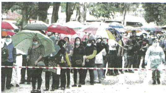
SEBAHAGIAN penduduk di PKPD Kota Setar yang disaring di Hospital Lama Alor Setar, Alor Setar kelmarin.

Kata beliau, proses saringan kes diteruskan dan dianggarkan antara 15,000 ribu hingga 20,000 penduduk di daerah ini akan di-